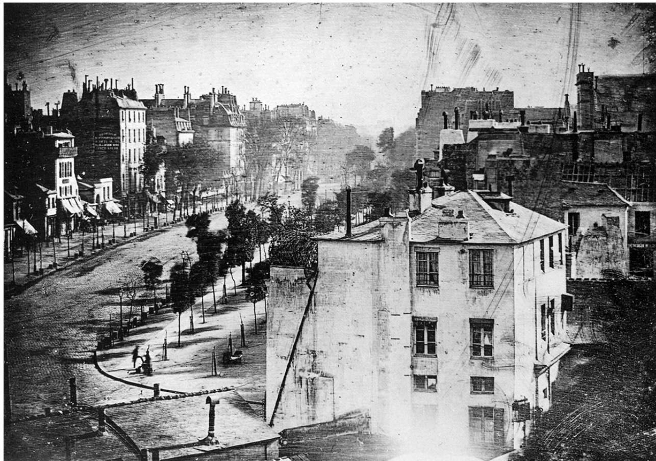
Louis-Jacques-Mandé Daguerre, Boulevard du temple , daguerréotype, 1838