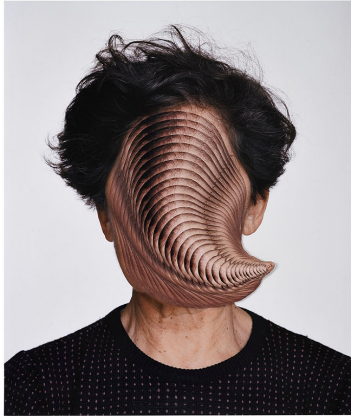
Esther Ferrer, Métamorphose (ou L'Évolution) , Photographie couleur, collage, 62 x 56 cm , 2005