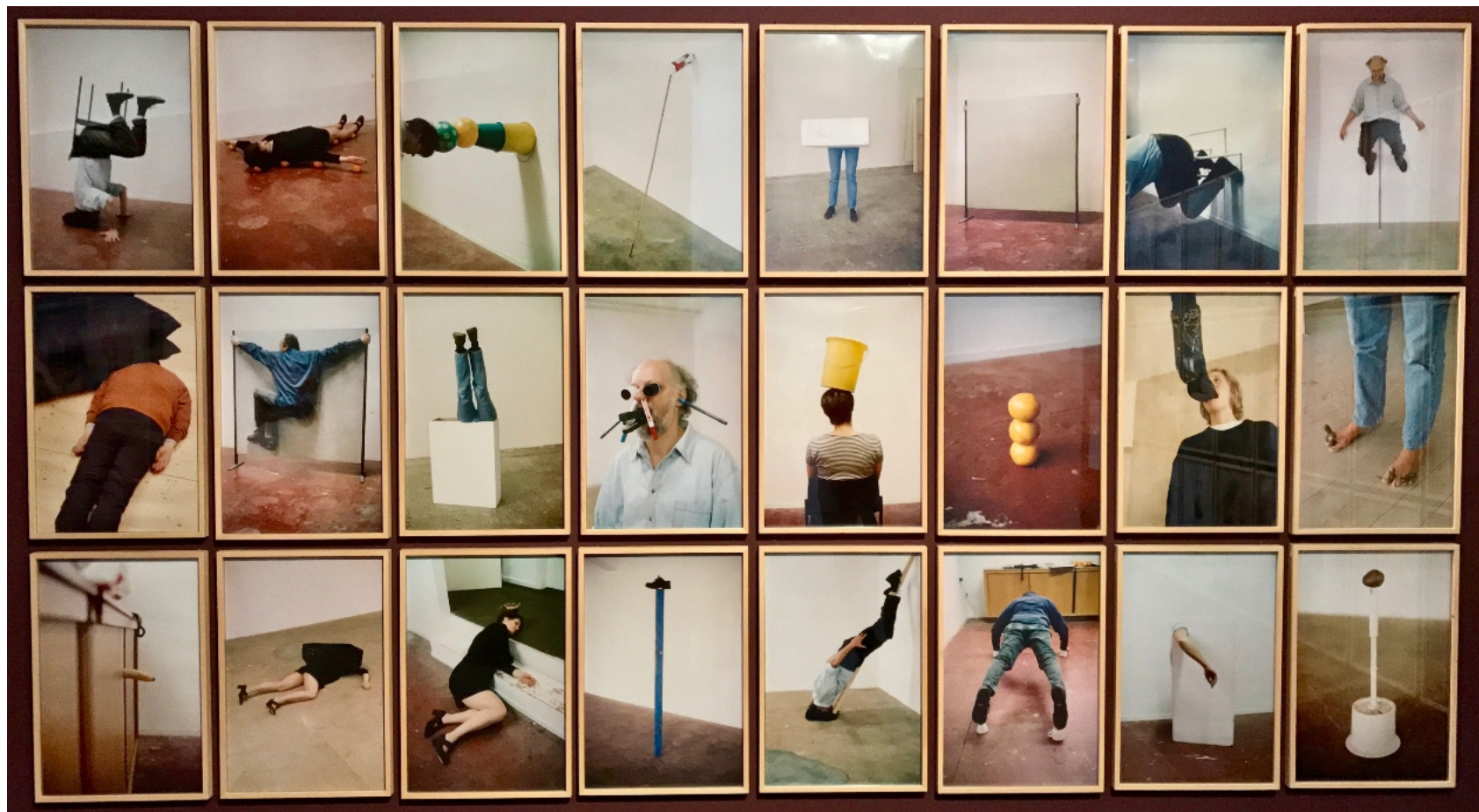
Erwin Wurm, One Minute Sculptures , Série de 48 photographies couleur, 45 x 30 cm chacune, 1997 - 1998