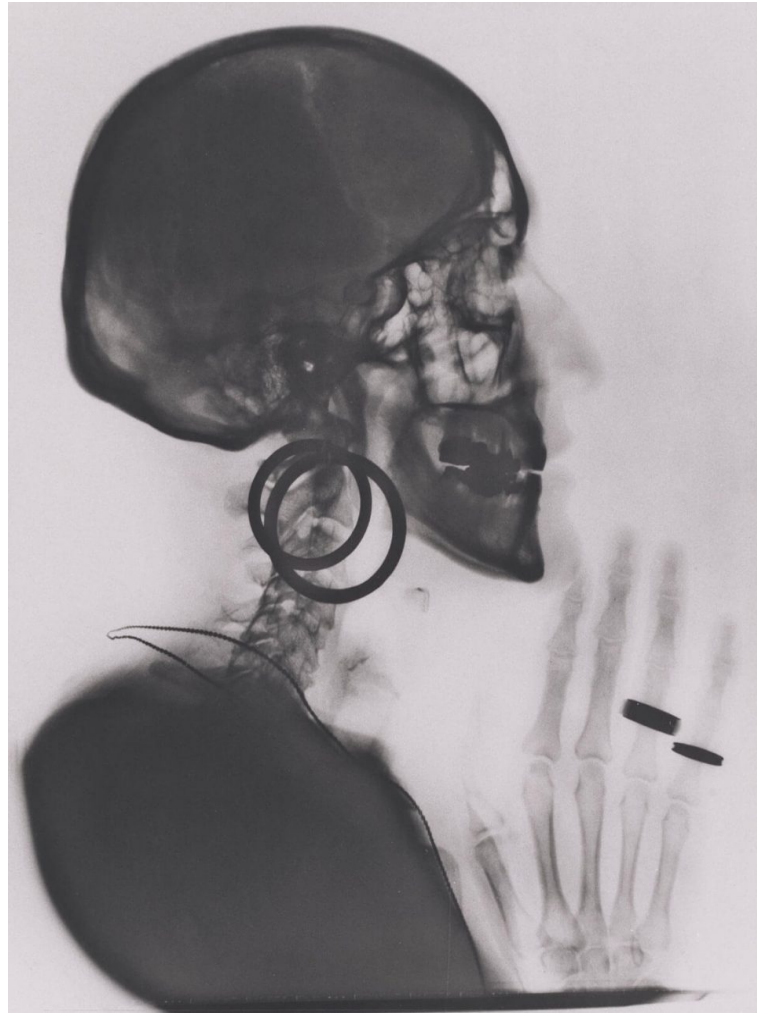
Meret Oppenheim, Radiographie du crâne de M.O , 1964