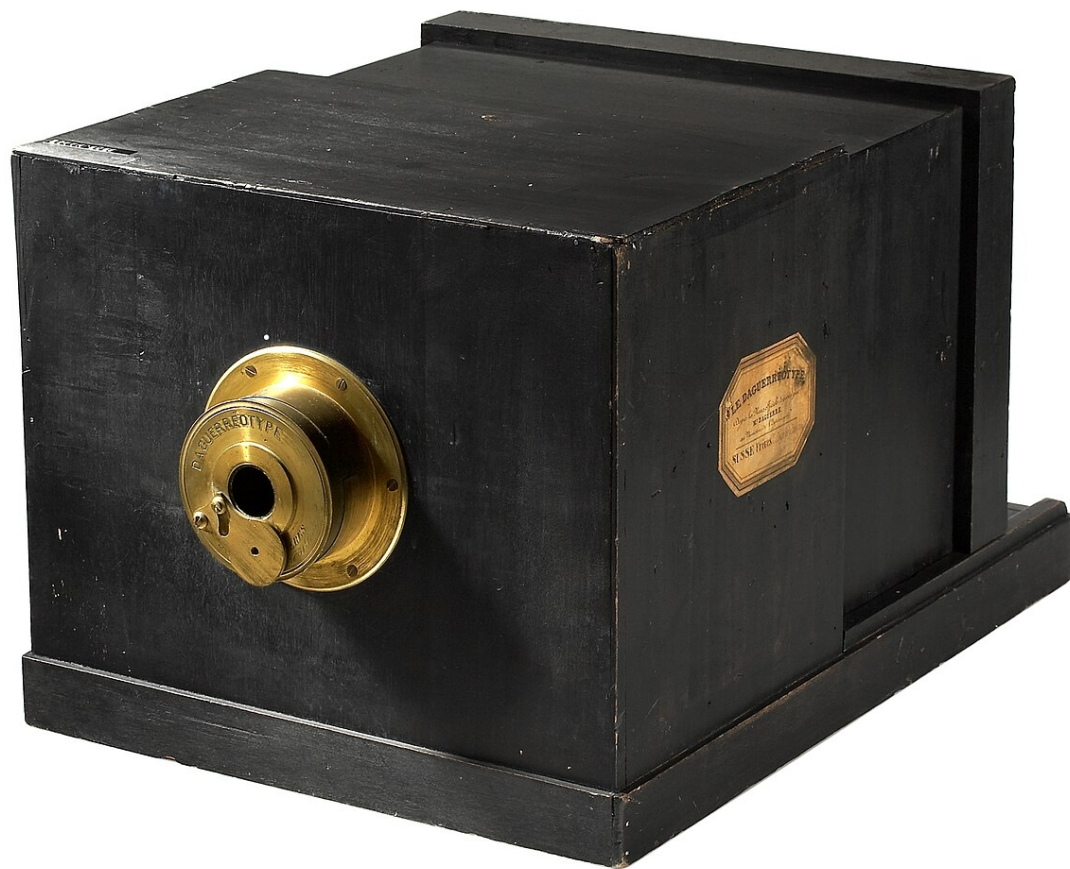
Daguerréotype , appareil construit par Susse Frères en 1839 sur les instructions de Daguerre